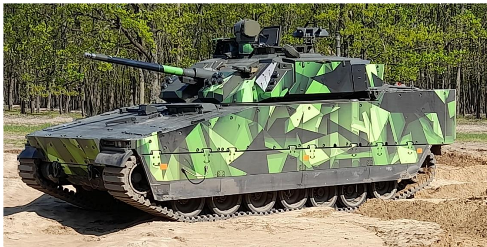
Obrázok č. 13 CV9030 – BAE Systems Hägglunds AB

ramenami. V ľavej prednej časti je miesto pre vodiča, vpravo je umiestnený vznetrový motor, veliteľ a strelec operátor sú umiestnení vo veži a zadný priestor je prispôbosený pre osem členov roja. Dvojmiestna veža je lafetovaná s automatickým kanónom NGIS 30 mm Bushmaster II Mk44 S alebo kanónom NGIS 35 mm Bushmaster III s rovnakou lafetáciou a rovnakým priestorom pre uloženie munície. Sekundárnu výbroj tvorí koaxiálny guľomet kalibru 7,62 mm. Na veži je integrované elektricky ovládané odpaľovacie zariadenie protitankových riadených striel pre dve rakety Spike LR/LR2. Veliteľ a strelec-operátor môžu pôsobiť v režime „hunter-killer“ (veliteľ odovzdáva operátorovi cieľ k zničeniu). CV90 poskytuje balistickú ochranu úrovne 5 a základnú ochranu proti mínám úrovne 4a/4b podľa STANAG 4569 s možnosťou zvýšenia obidvoch úrovní ochrany. Spoločnosť Hägglunds ponúka verziu vozidla CV90120 s vežou s kanónom kalibru 120 mm.