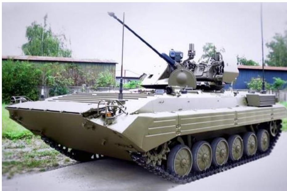
Obrázok č. 4 BPsV-I (bojové prieskumné vozidlo ISTAR)

Na Slovensku bola realizovaná modernizácia tohto BPsV na verziu BPsV-ISTAR (Obrázok č. 4), pričom bola vykonaná výmena celého vežového kompletu (pôvodného z BVP-1) za vežový komplet TURRA-30. Výrazne bola obmenená aj celá výbava vozidla.