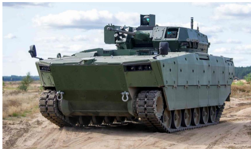
Obrázok č. 14 BORSUK – Polish Armaments Group (PGZ)

Bojové vozidlo pechoty BORSUK (Obrázok č.14) je vývojová platforma spoločnosti Huta Stalowa Wola S.A. (HSW), člen poľského koncernu PGZ (Polska Grupa Zbrojenowa). V súčasnosti vozidlo nie je zavedené v žiadnej armáde sveta. Podvozok je konštruovaný so šiestimi pojazďovými kolesami. V ľavej prednej časti je miesto pre vodiča, vpravo je umiestnený vznetový motor, veliteľ a strelec operátor sú umiestnení v korbe vozidla a zadný priestor je prispôsobený pre šesť členov roja. Bezosádková veža ZSSW-30 je lafetovaná s automatickým kanónom NGIS 30 mm Bushmaster II Mk44 S. Sekundárnu výzbroj tvorí koaxiálny guľomet kalibru 7,62 mm. Na veži je integrované elektricky ovládané odpaľovacie zariadenie protitankových riadených striel pre dve rakety Spike LR/LR2. Veliteľ a strelec-operátor môžu pôsobiť v režime „hunter-killer“ (veliteľ odovzdáva operátorovi cieľ k zničeniu). Pre vozidlo BORSUK nie je známy stupeň balistickej ochrany ani stupeň ochrany proti mínam.