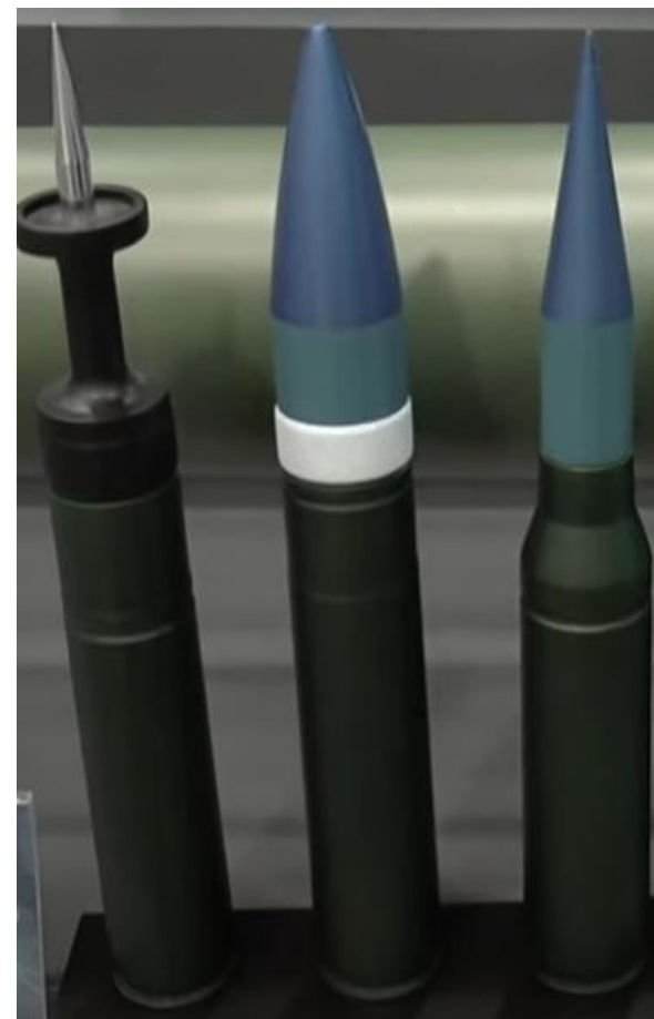
Obrázok č. 17 munícia 50 x 228 mm / 35 x 228 mm