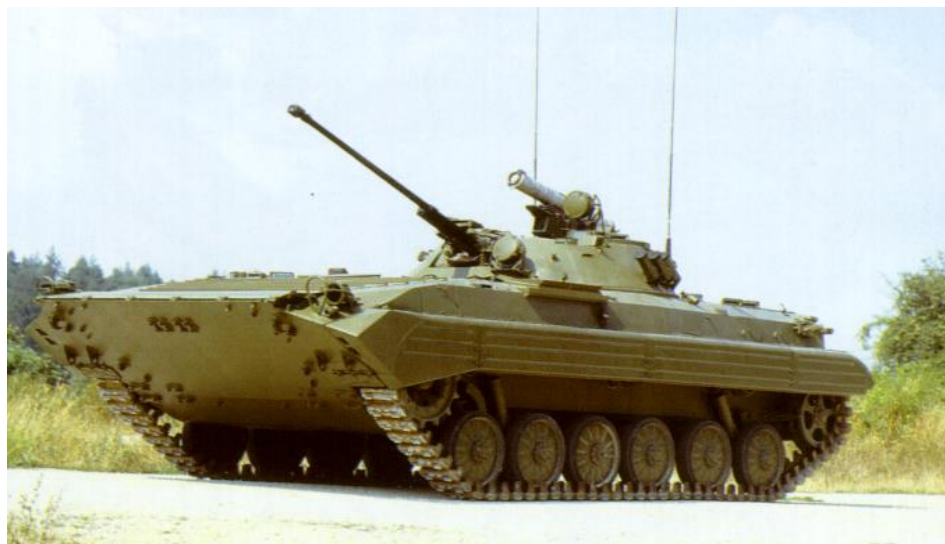
Obrázok č. 1 BVP-2 (bojové vozidlo pechoty 2)