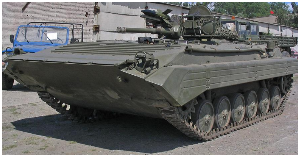
Obrázok č. 3 BPsV (Bojové prieskumné vozidlo)

Bojové prieskumné vozidlo (ďalej len „BPsV“) bolo určené pre vykonávanie prieskumnej alebo bojovej činnosti v tyle protivníka. BPsV (Obrázok č. 3) bolo postavené na podvozku BVP-1. V rámci mimoriadnej výbavy, špecifickej k hlavnej činnosti, bol na BVP-1 integrovaný nočný pozorovací prístroj veliteľa NNP-21 s integrovaným laserovým diaľkometerom DAK-2 a rádiolokátorom PSNR-5, rádiolokačným pátračom MRP-4. Súčasťou bol aj navigačný prístroj TNA-3 a prostriedok protichemického prieskumu.