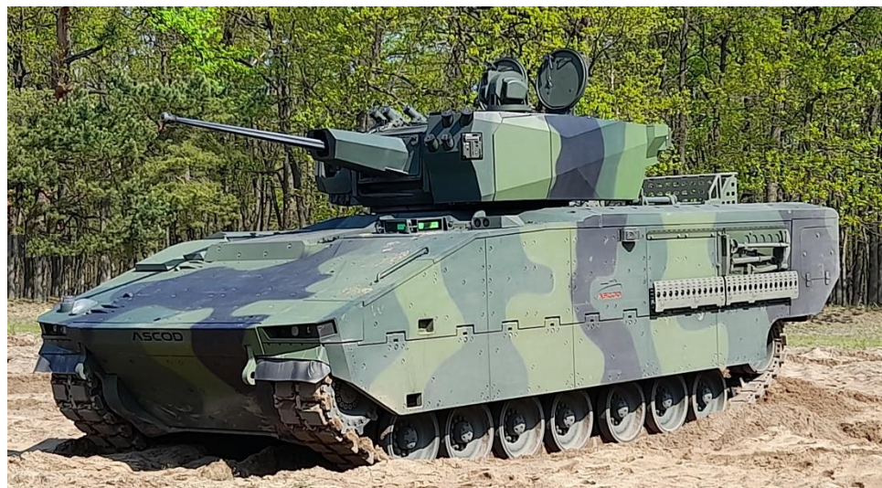
Obrázok č. 12 ASCOD – GDELS Santa Bárbara Sistemas