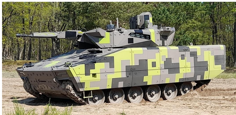
Obrázok č. 11 LYNX KF41 – Rheinmetall Landsysteme GmbH

od austrálskej firmy Supashock. V pravej prednej časti sa nachádza vznetový motor (výkon v závislosti na verzii), vľavo miesto vodiča, za ním miesto veliteľa a strelca-operátora. Ich pozícia môže byť voliteľná v korbe alebo vo veži, pretože vozidlo LYNX môže byť vybavené bezosádkovou (diaľkovo ovládanou) alebo osádkovou vežou. Do veže je možné voliteľne lafetovať, buď 35 mm plne stabilizovaný, externe poháňaný automatický kanón Wotan, alebo 30 mm kanón MK30-2/ABM. Vľavo od kanónu je spriahnutý (koaxiálny) 7,62 mm guľomet RMG 7.62. Na strop veže je možné umiestniť diaľkovo ovládanú zbraňovú stanicu s 12,7 mm guľometom M2HB. Na bokoch veže sa môžu nachádzať moduly s protitankovými riadenými strelami Spike (Spike LR/LR2), protiletadlovými riadenými strelami, alebo s bezpilotnými prostriedkami. Veliteľ a strelec-operátor môžu pôsobiť v režime „hunter-killer“ (veliteľ odovzdáva operátorovi cieľ k zničeniu). Modulárna balistická ochrana je od úrovne 5 a mínová ochrana je ponúkaná od úrovne 4a/3b podľa STANAG 4569 s možnosťou zvýšenia úrovni obidvoch ochrán. V roku 2022 spoločnosť Rheinmetall oznámila možnosť osadenia veže s kanónom kalibru 120 mm. LYNX KF41 vstupuje do prevádzky v Maďarskej republike a je v prevádzke/testovaní v Austrálii.