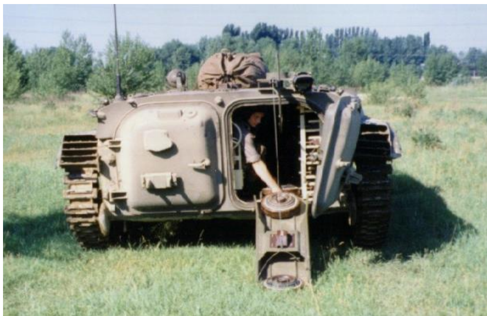
Obrázok č. 9 MU-90 (Mínový ukladač)

Ďalší z rady špeciálnych aplikácií realizovaných na podvozku BVP-1 je mínový ukladač – 90 (ďalej len „MU-90“). MU-90 (Obrázok č. 9) je určený na povrchové kladenie mín. Míny sú ručne spúšťané na terén osádkou po mechanickej sklznici umiestnenej v zadnej časti otvorených dverí. Vo vnútri vozidla je k dispozícii 110 ks protitankových mín univerzálnych (PT-Mi-U) alebo protitankových mín bakelitových (PT-Mi-Ba-III). Veľká časť štandardnej výbavy vozidla BVP-1 je demontovaná z dôvodu potreby integrácie veľkých zásobníkov. U MU-90 došlo k výraznej zmene ťažiska vozidla a preto nie je schopné plavby.