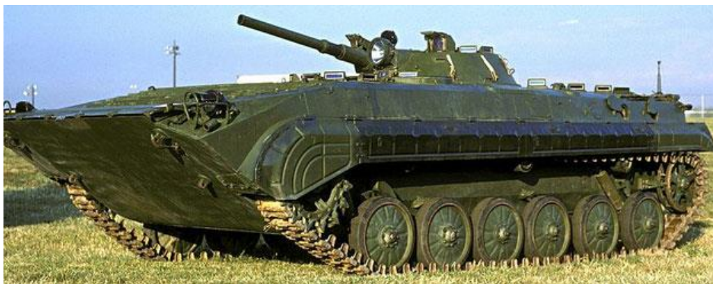
Obrázok č. 2 BVP-1 (Bojové vozidlo pechoty 1)

účinku pribojnej munície do kalibra 7,62 mm na vzdialenosť min. 100 m a na čelnom pancieri proti účinkom pribojnej munície až do kalibra 23 mm na vzdialenosť min. 500 m. Vozidlo je vybavené ochranou proti zbraniam hromadného ničenia, protipožiarnym zariadením a ventilačným systémom. Hlavným pozitívnym charakteristickým znakom BVP-1 je vysoká mobilita v teréne, schopnosť prekonávať vodné prekážky plávaním a veľmi nízkou siluetou. V súčasnosti, v zmysle základných princípov uvedených v úvode state, táto kľúčová technika nezabezpečuje požiadavky interoperability. Integrovaný základný komunikačný prostriedok je rádiostanica R-123 RUS, pracujúca iba na jednej frekvencii, bez možnosti spojenia v utajovanom režime, bez možnosti prenosu dát a integrácie systému velenia a riadenia (ďalej len „C2“). Aj napriek tomu, že mobilita techniky je na vysokej úrovni, palebná sila nezodpovedá požiadavkám na modernú techniku. Dostrel hlavnej zbrane 1300 m za optimálnych podmienok, efektívny dostrel iba 800m, v podmienkach zníženej viditeľnosti len 500 m, absencia stabilizácie zbraní v dvoch rovinách, absencia systému riadenia paľby.