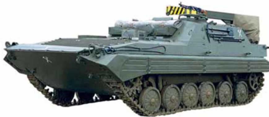
Obrázok č. 6 DTP-90 (Dielňa technickej pomoci)

Špeciálne obojživelné pásové obrnené vozidlo, ktorého základom bol obrnený transportér OT-90. Dielňa technickej pomoci (Obrázok č. 6) je vybavená náradím, prípravkami, zariadením, vybranými náhradnými dielmi a prevádzkovým materiálom k vykonávaniu ošetrovania a opráv techniky T-72, BVP a OT v poľných podmienkach. Používa sa hlavne k vyhľadávaniu poškodenej techniky vo dne aj v noci, k technickému prieskumu, vlečeniu poškodenej techniky, k odstraňovaniu jej prevádzkových porúch, k zváraní a rezaniu plameňom a k zdvíhaniu bremien.