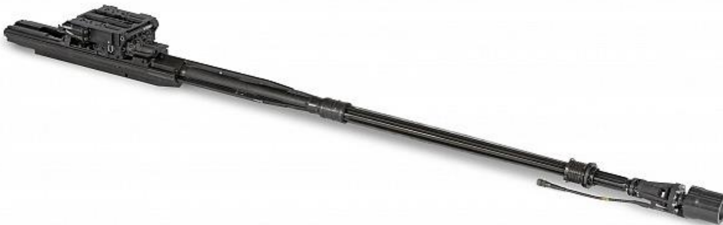
Obrázok č. 19 MK30-2 ABM