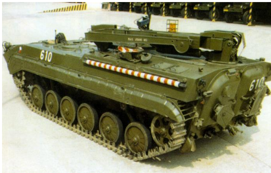
Obrázok č. 5 VPV (Vyslobodzovacie pásové vozidlo)

Vyslobodzovacie pásové vozidlo (ďalej len „VPV“) bolo prioritne určené na vyslobodzovanie zapadnutej techniky triedy BVP v ťažkom teréne a jej opravu v terénnych podmienkach. VPV (Obrázok č. 5) je vybavené hydraulicky ovládaným žeriavom s nosnosťou 6,5 tony, výkonným navijakom s priamym ťahom 125 kN, zväracím agregátom a množstvom prípravkov pre demontáž a montáž hlavných skupín z BVP-1/2 v terénnych podmienkach.