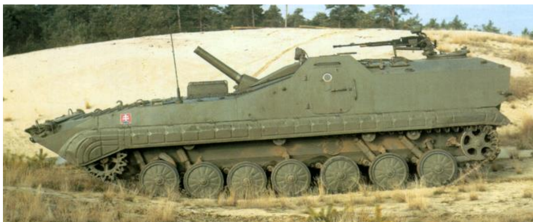
Obrázok č. 10 120mm ShM vz. 85 Prám/S (Samohybný mínomet)

120 mm samohybný mínomet vz. 85 Prám/S (ďalej len 120 mm „ShM“) je výsledkom vývojových prác v SR. Vývoj bol realizovaný v 90 rokoch, pričom za základ bol použitý podvozok BVP-1. Vzhľadom k niektorým technickým požiadavkám a potrebe zachovať schopnosť plávania bola výsledná verzia 120 mm ShM (Obrázok č. 10) zrealizovaná na predĺženom podvozku pôvodnej platformy BVP-1, pričom bolo pridané jedno pojazďové koleso na každej strane. Bol vyvinutý a integrovaný unikátny zbraňový systém pre využitie štandardnej 120 mm míny používanej v krajinách Varšavskej zmluvy. Maximálny dostrel bol cca 8000 m s kadenciou 18 - 20 výstrelov za minútu (nabíjanie munície automatom nabíjania). Osádku tvorili 4 osoby. Vo vozidle bolo celkovo vezených 80 ks mín. Mobilita bola na úrovni ostatných vozidiel kategórie BVP. V súčasnosti tento druh techniky OS SR nemajú zaradenú do výbroje. Niekoľko kusov je v uložení vo VTSÚ Záhorie s využitím, ako inžiniersky model s cieľom modernizovať a zvýšiť efektivitu použitia jednotlivých integrovaných systémov.