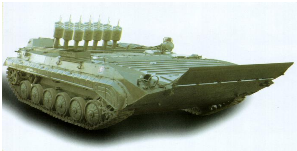
Obrázok č. 8 SVO (Samohybný výbušný odmínovač)

Unikátny odmínovací prostriedok slúžiaci pre vytvorenie priechodu v mínovom poli. Samohybný výbušný odmínovač (ďalej len „SVO“) má integrovaných 24 vrhačov – vystreľovacích trnov pre raketu s bojovou hlavickou obsahujúcou cca 25 kg trhaviny. Vrhače SVO (Obrázok č. 8) sú špecificky vzájomne natočené čo systému umožňuje v priebehu pár sekúnd vystreliť tieto rakety do priestoru mínového poľa na vzdialenosť 250 - 430 m, pričom po dopade a explózii munície, sú všetky míny umiestnené v teréne zničené mechanicky alebo tlakovou vlnou uvedené do činnosti. Tým sa vytvorí v tomto poli pás minimálnej šírky 5 m a minimálnej dĺžky 100 m, ktorý umožňuje bezpečný prechod techniky. Hlavnou výhodou tohto odmínovania je rýchlosť a spoľahlivosť realizácie. Vozidlo je postavené na základe BVP-1 s adekvátnymi charakteristikami pohyblivosti a vybavením. Bol vyvinutý a vyrobený v SR.