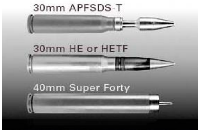
Obrázok č. 15 Porovnanie munície 30 mm/40 mm super forty (SuperShot)