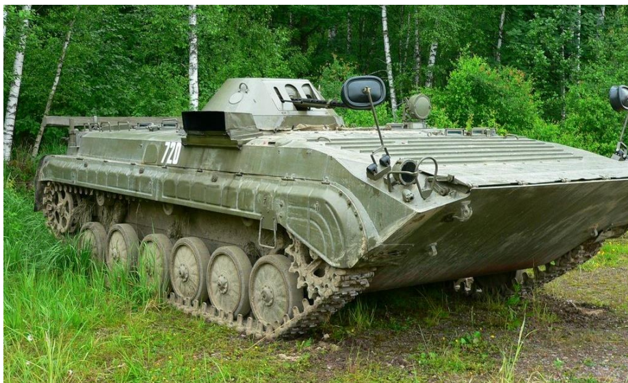
Obrázok č. 7 OT-90 (Obrnený transportér)

Táto a nasledujúce modifikácie budú predmetom obmeny v druhej etape projektu PBOV a POV. Po redukcii stavu konvenčnej výzbroje v Európe, bolo potrebné likvidovať väčšie množstvo BVP-1, čoho výsledkom boli obrnené transportéry – 90 (ďalej len „OT“) (Obrázok č.7). Bolo prijaté rozhodnutie pre záchranu kvalitného podvozku s unikátnymi charakteristikami, najmä v oblasti mobility a vybavenia, a to integrovať na podvozok BVP-1 vežový komplet s výzbrojou menšou ako 20 mm. V danej dobe boli likvidované OT-64, pričom práve vežový komplet s 14,5 mm guľometom sa javil ako ideálny pre montáž na podvozok BVP-1.